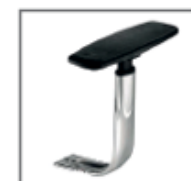
B/Reg BRc 19 CR