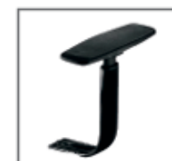
B/Reg.BRC 22 PP